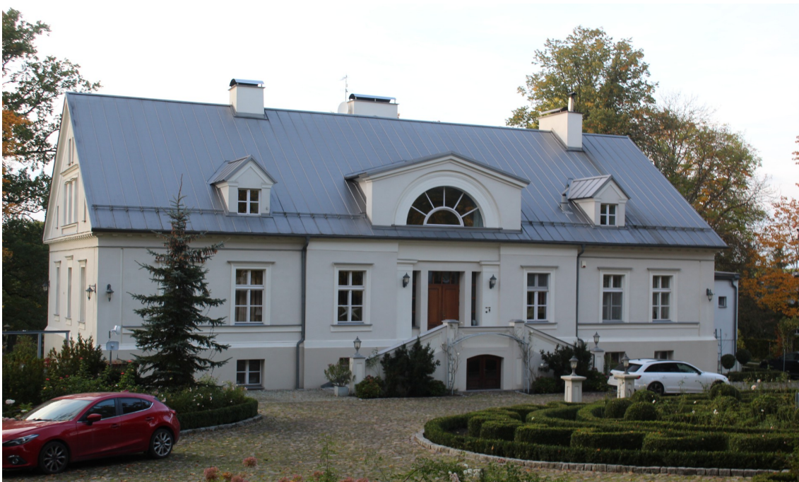
Ilustracja 84. Jarcewo, ul. Kasztanowa 2. Dwór w zespole dworsko - parkowym. Budynek w charakterze dworu z elementami architektury pałacowej. Obiekt wpisany do rejestru zabytków pod numerem 1681.