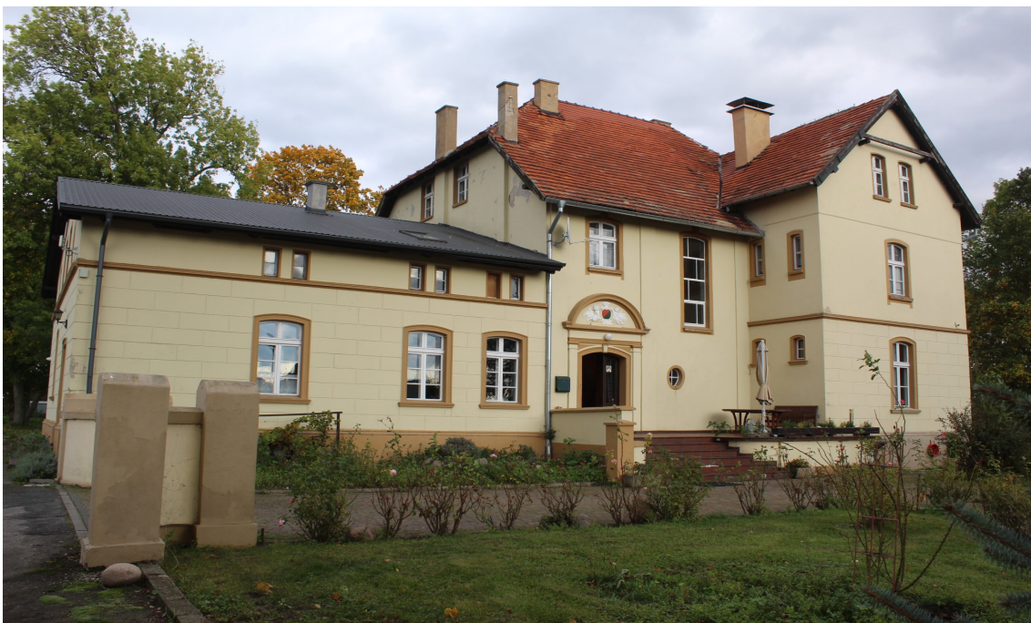
Ilustracja 88. Silno, ul. Główna 14. Obiekt w zespole dworsko-parkowym. Dwór w charakterze budynku rezydencjonalnego. Obiekt w rejestrze zabytków pod numerem 1080.