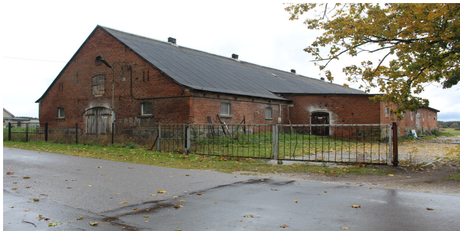
Ilustracja 106. Kruszką 16, budynek gospodarczy.

Budynek stajni z oborą. Obiekt w konstrukcji murowanej. Okazała, zwarta, wydłużona bryła 2 – kondygnacyjna, dach dwuspadowy kryty eternitem. Elewacje kształtowane w cegle. Otwory okienne w formie zbliżone do kwadratu, zwieńczone łukiem odcinkowym, stolarka współczesna. W poddaszu niewielkie wrota, nad nimi okulus. W szczycie oryginalne zwieńczone łukiem odcinkowym wrota szalowane pionowo deskami. Budynek na kamiennym cokole z kamienia granitowego. Stolarka drzwiowa szalowana pionowo deskami. Od tyłu oryginalna przybudówka z wypłaszczonym jednospadowym dachem, krytym papą.