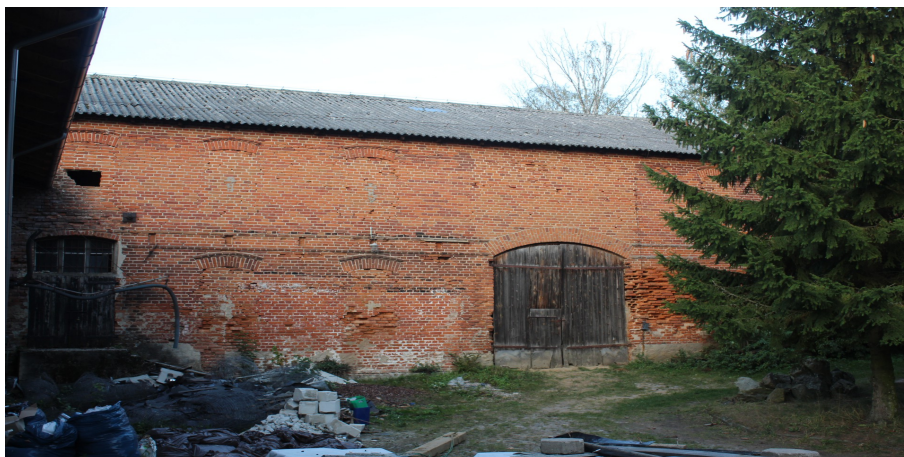
Ilustracja 104. Jarcewo, ul. Kasztanowa 3, stodoła.

Budynek 2 – kondygnacyjny, na planie wydłużonego prostokąta, opracowany w cegle, posadowiony na niskim, kamiennym cokole. Nakryty dachem dwuspadowym o lekkim nachyleniu połaci, kryty eternitem. Zachodnia elewacja przylega prostopadle do budynku gorzelnii. Częściowo zachowane otwory drzwiowe. W elewacji południowej – wzdłużnej, w jej części zachodniej, schody do budynku; drzwi drewniane oraz pierwotne dwie bramy drewniane szalowane pionowo; otwory drzwiowe zwieńczone łukiem odcinkowym opracowanym w cegle. Liczne ślady zamurowań otworów okiennych i drzwiowych, zarówno na poziomie parteru jak i w partii drugiej kondygnacji, w niej liczne otwory wentylacyjne w formie krzyża. Zachowane opracowane w cegle łuki odcinkowe zamurowanych otworów okiennych i drzwiowych.