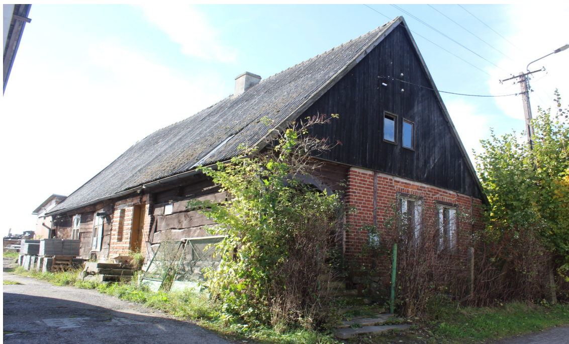
Ilustracja 51. Silno ul. Przrzeczna 10 – charakterystyczne elementy – szczyt szalowany pionowo deskami, część elewacji we wtórnych okładzinach – podcień.