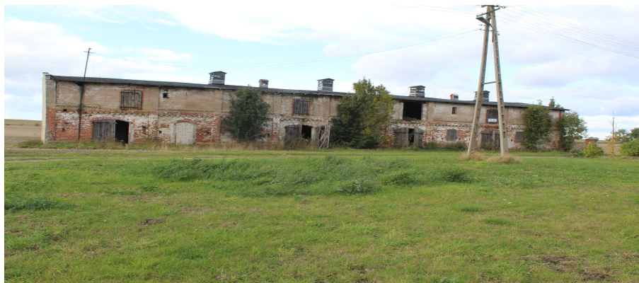
Ilustracja 97. Ciechocin ul. Pogodna 9, budynek gospodarczy w zespole dworsko – folwarczno – parkowym.

Budynek gospodarczy w zespole dawnego dworu, oddalony od dworu na pd.-zach. Budynek dwukondygnacyjny, opracowany w cegle z drewnianym użytkowym poddaszem, na rzucie wydłużonego prostokąta. Poddasze odeskowane w układzie poziomym. Nakryty dachem dwuspadowym o lekkim nachyleniu, kryty papą. Wtórne drzwi (odeskowane w układzie pionowym) nawiązujące rozmieszczeniem i wyglądem do historycznych. Otwory okienne i drzwiowe (w elewacji murowanej) zamknięte łukiem odcinkowym, opracowanym w cegle. Gzymsy podokienne z profilowanej cegły. W partii poddasza drzwi drewniane (odeskowane w układzie pionowym) - w części frontowej. Małe prostokątne okna w elewacjach szczytowych.