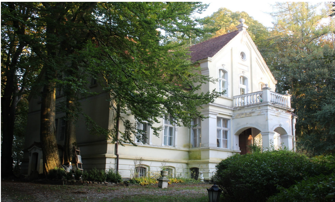
Ilustracja 83. Czartołomie 7. Dwór w zespole dworsko - parkowym. Budynek w typie dworu z elementami architektury pałacowej. Obiekt wpisany do rejestru zabytków pod numerem 1680.