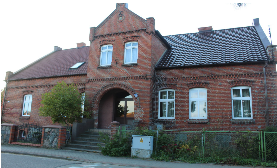
Ilustracja 66. Ostrowite ul. Szkolna 16-18 – budynek mieszkalny – charakterystyczny element – ryzalitowo wysunięta facjata z portalem wgłębny.