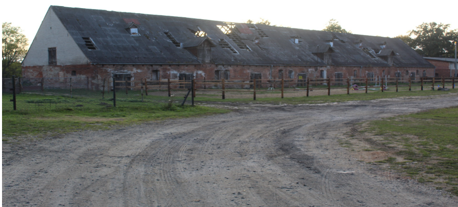
Ilustracja 102. Jarcewo, ul. Kasztanowa 2, obora.

Budynek gospodarczy, dawny kurnik, parterowy z poddaszem nieużytkowanym, na planie prostokąta, posadowiony na niskim, kamiennie – ceglany cokole. Nakryty dachem dwuspadowym, o znacznym kącie nachylenia połaci, kryty dachówką ceramiczną. Częściowo zachowany układ otworów drzwiowych w elewacji wschodniej – wzdłużnej. Zachowane otwory okienne, okna z podziałami. Otwory okienne i zamurowane otwory drzwiowe w elewacji wschodniej zwieńczone dekoracyjnie pionowymi cegiełkami. W elewacji szczytowej – północnej wtórna drewniana brama garażowa, nad nią zachowany otwór drzwiowy, drzwi drewniane – wtórne oraz małe, w formie kwadratu otwory wentylacyjne. Detal w formie gzymsu podokapowego artykułowanego w cegle, w elewacji szczytowej narożne pilastry.