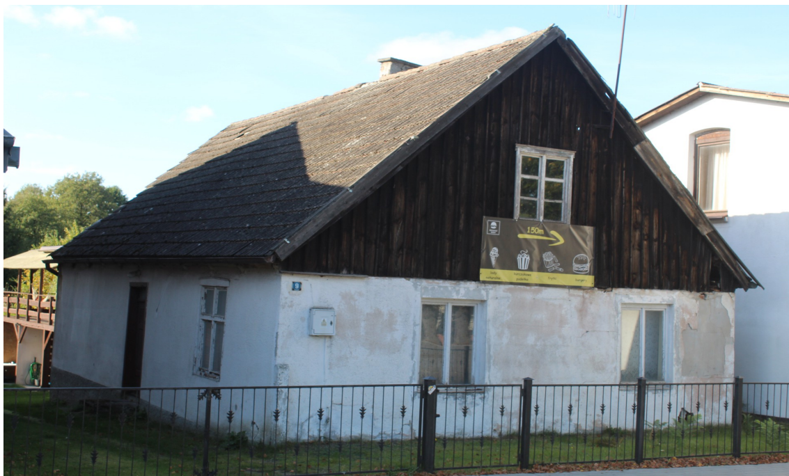
Ilustracja 57. Swornegacie, ul. Mestwina 9 – chałupa z drewnianym szczytem.

drewnianymi szczytami. Budynki te nawiązują w formie do budownictwa drewnianego, które stanowiło „prototyp”.