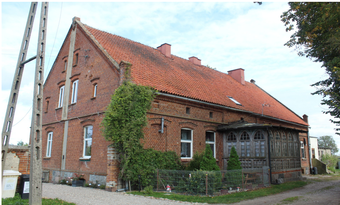
Ilustracja 81. Ciechocin Pogodna 9. Dwór w zespole – budynek w charakterze wiejskim z okazałą historyczną werandą. Przy budynku zachował się park wraz z ogrodzeniem.