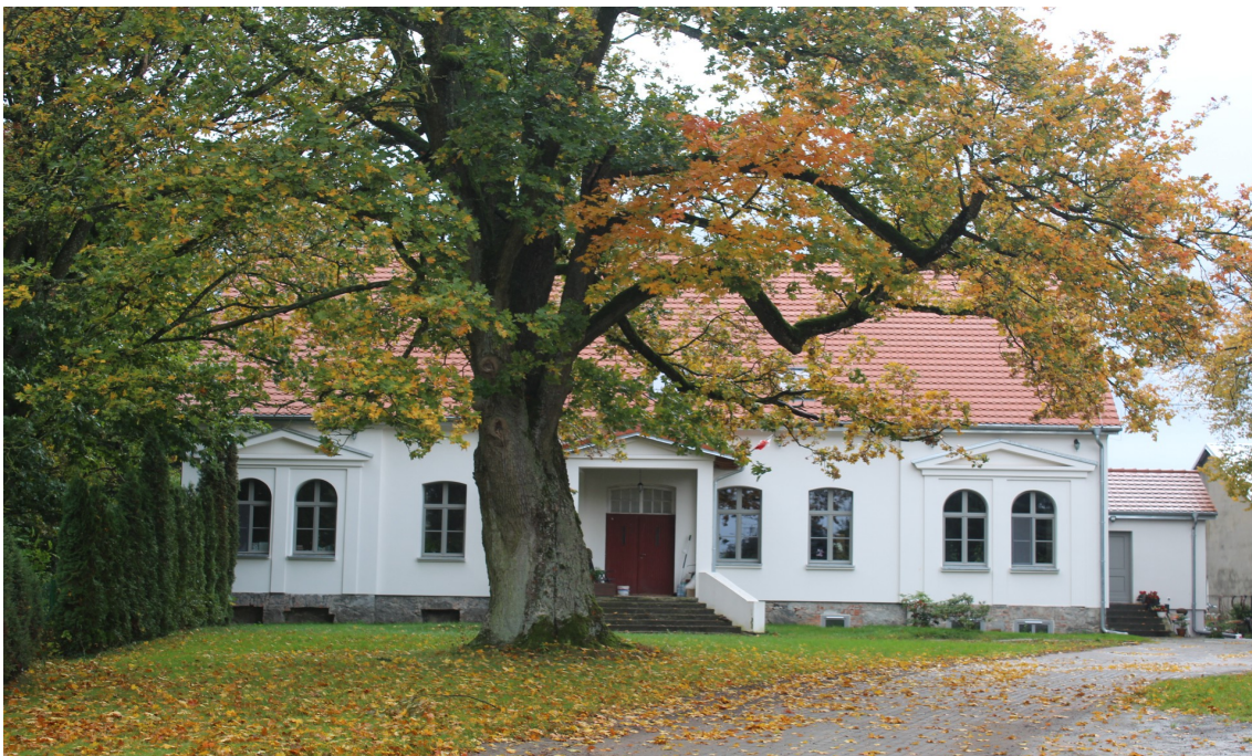
Ilustracja 87. Pawłówko, ul. Przytorowa 25. Budynek w zespole dworsko-parkowym. Dwór w charakterze wiejskim.