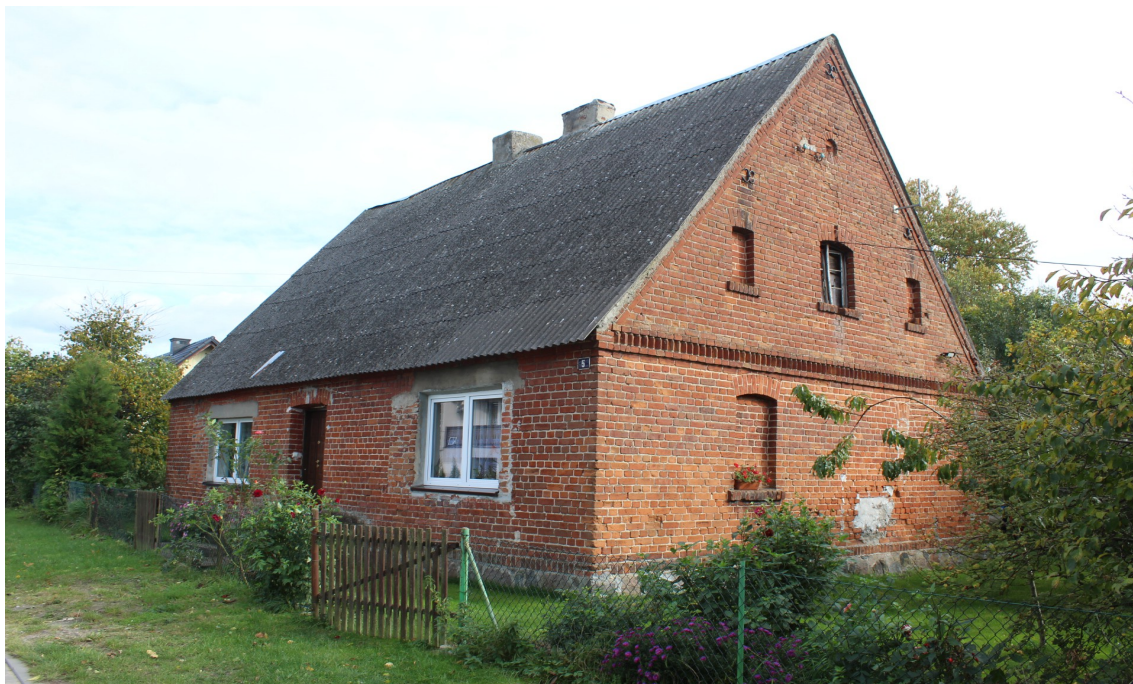
Ilustracja 61. Sławęcín 5 – budynek mieszkalny – charakterystyczny element - okno w szczycie flankowane dwiema niszami.

Ceglana architektura domów wiejskich naśladowała formy obecne w architekturze drewnianej, stąd pojawiły się domy z użytkowym poddaszem w formie półpiętra, z wypłaszczonym dachem i gzymsem, odcinającym parter od piętra (w budynku drewnianym była to deska okapowa).