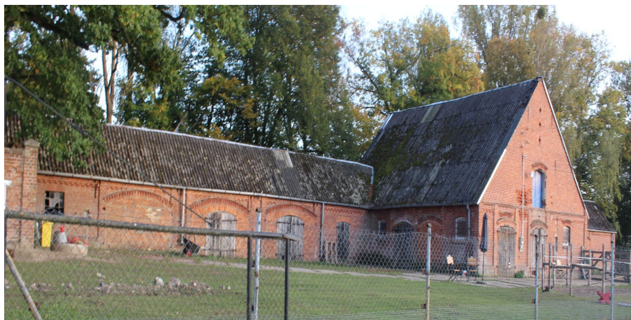
Ilustracja 103. Jarcewo, ul. Kasztanowa 2, stajnia.

w części wschodniej ryzalit mocno wysunięty, pozostałe 2 – mniejsze. Zachowane rozmieszczenie otworów okiennych i drzwiowych zwieńczonych łukiem odcinkowym opracowanym w cegle. Część otworów okiennych w formie blend, bądź zamurowana. W górnej partii elewacji wzdłużnych, pod okapem, małe, kwadratowe otwory wentylacyjne. Detal w formie gzymsu podokiennego, proste gzymsy ceglane w elewacjach szczytowych.