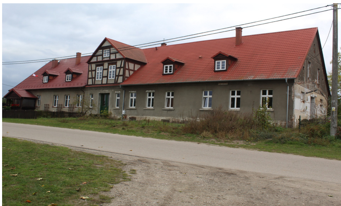
Ilustracja 86. Lotyń 32. Budynek w zespole dworsko-parkowym. Dwór w charakterze wiejskim.