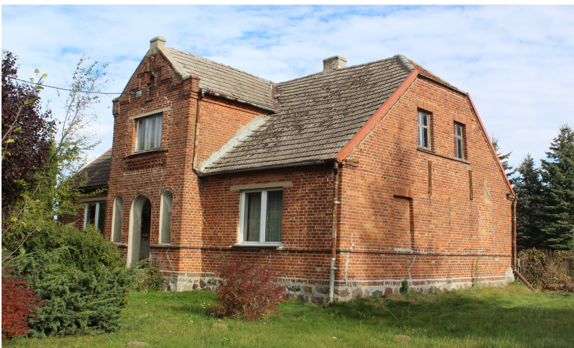
Ilustracja 65. Ogorzeliny ul. Obkaska 29 – budynek mieszkalny - charakterystyczny element – ryzalitowo wysunięta facjata z portalem wgłębny.