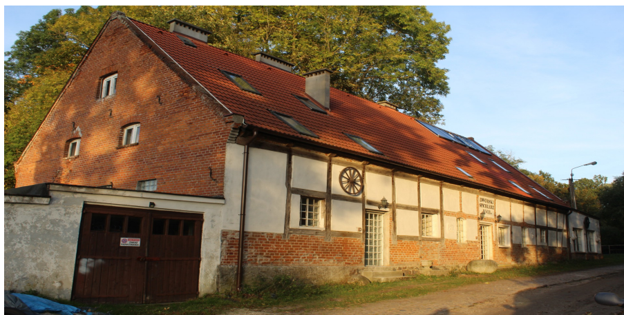
Ilustracja 98. Czartolomie 7, spichlerz w zespole folwarcznym.

Budynek gospodarski, dwukondygnacyjny, na rzucie wydłużonego prostokąta. Posadowiony na kamiennym cokole. Opracowany w cegle. Elewacje artykułowane lizenami w układzie regularnym. Detal w postaci licznych gzymsów, odcinkowych łuków nadokiennych i łuków nad otworami drzwiowymi, które zdobione są fryzem ząbkowym. Budynek nakryty dachem dwuspadowym o niewielki kącie nachylenia połaci, kryty papą. Pierwotne otwory okienne i drzwiowe zwieńczone łukiem odcinkowym opracowanym w cegle. Część otworów okiennych i drzwiowych wtórnie zablendowana lub zamurowana. Stolarka drzwiowa szalowana pionowo.