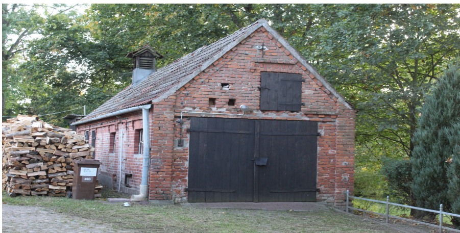
Ilustracja 101. Jarcewo, ul. Kasztanowa 2, kurnik.

Budynek gospodarczy, dawny kurnik, parterowy z poddaszem nieużytkowanym, na planie prostokąta, posadowiony na niskim, kamiennie – ceglany cokole. Nakryty dachem dwuspadowym, o znacznym kącie nachylenia połaci, kryty dachówką ceramiczną. Częściowo zachowany układ otworów drzwiowych w elewacji wschodniej – wzdłużnej. Zachowane otwory okienne, okna z podziałami. Otwory okienne i zamurowane otwory drzwiowe w elewacji wschodniej zwieńczone dekoracyjnie pionowymi cegiełkami. W elewacji szczytowej – północnej wtórna drewniana brama garażowa, nad nią zachowany otwór drzwiowy, drzwi drewniane – wtórne oraz małe, w formie kwadratu otwory wentylacyjne. Detal w formie gzymsu podokapowego artykułowanego w cegle, w elewacji szczytowej narożne pilastry.