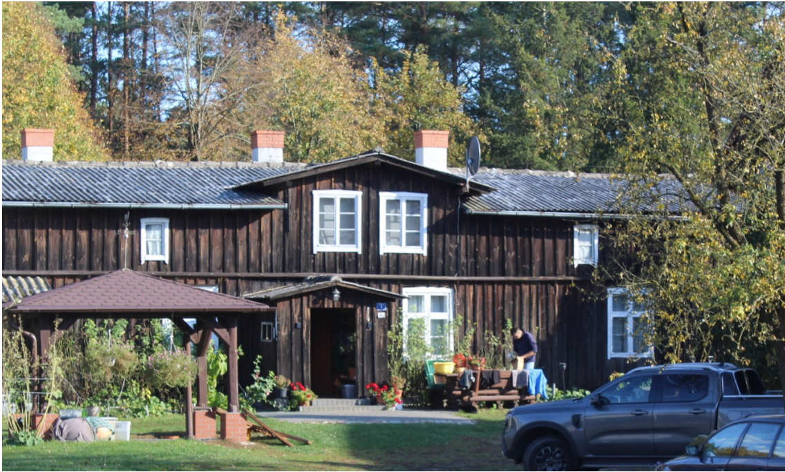
Ilustracja 55. Płesno 1 - charakterystyczne elementy – w centralnej części poddasze przechodzi w niewielką lukarnę.

Na terenie gminy znajdują się również zabytkowe budynki drewniane o charakterze letniskowym – parterowe, ze stolarką z okiennicami.