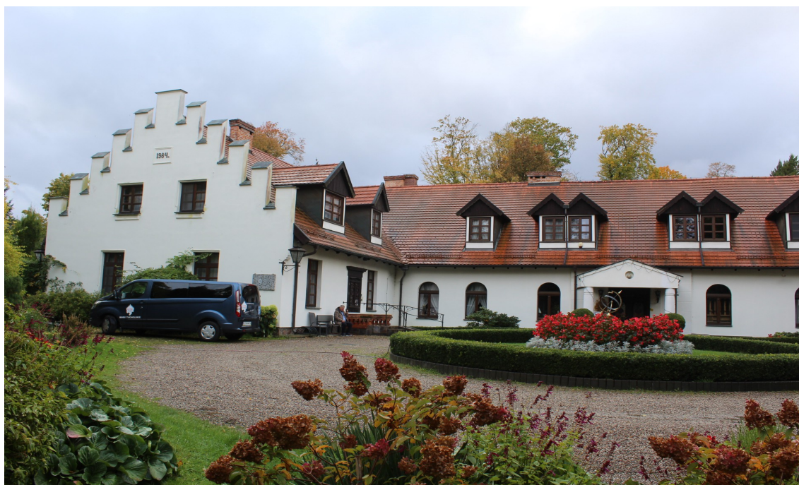
Ilustracja 85. Krojanty, ul. 18 Pułku Ułanów Pomorskich 7. Obiekt częściowo przebudowany w charakterze dworu rezydencjonalnego. Obiekt w zespole wraz z parkiem. Obiekt wpisany do rejestru zabytków o numerze 1682.