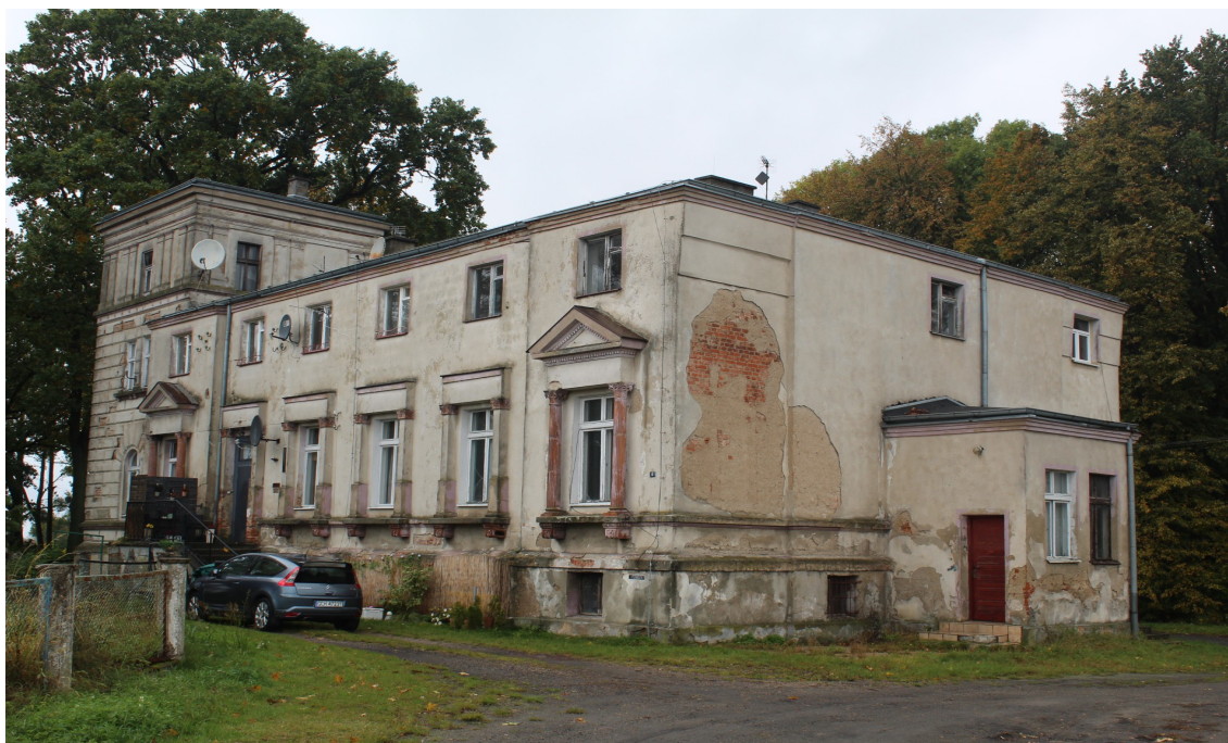
Ilustracja 82. Chojnaty 6. Dwór w zespole dworsko – parkowym. Obiekt w typie architektury rezydencjonalnej z detalem neostylowym.