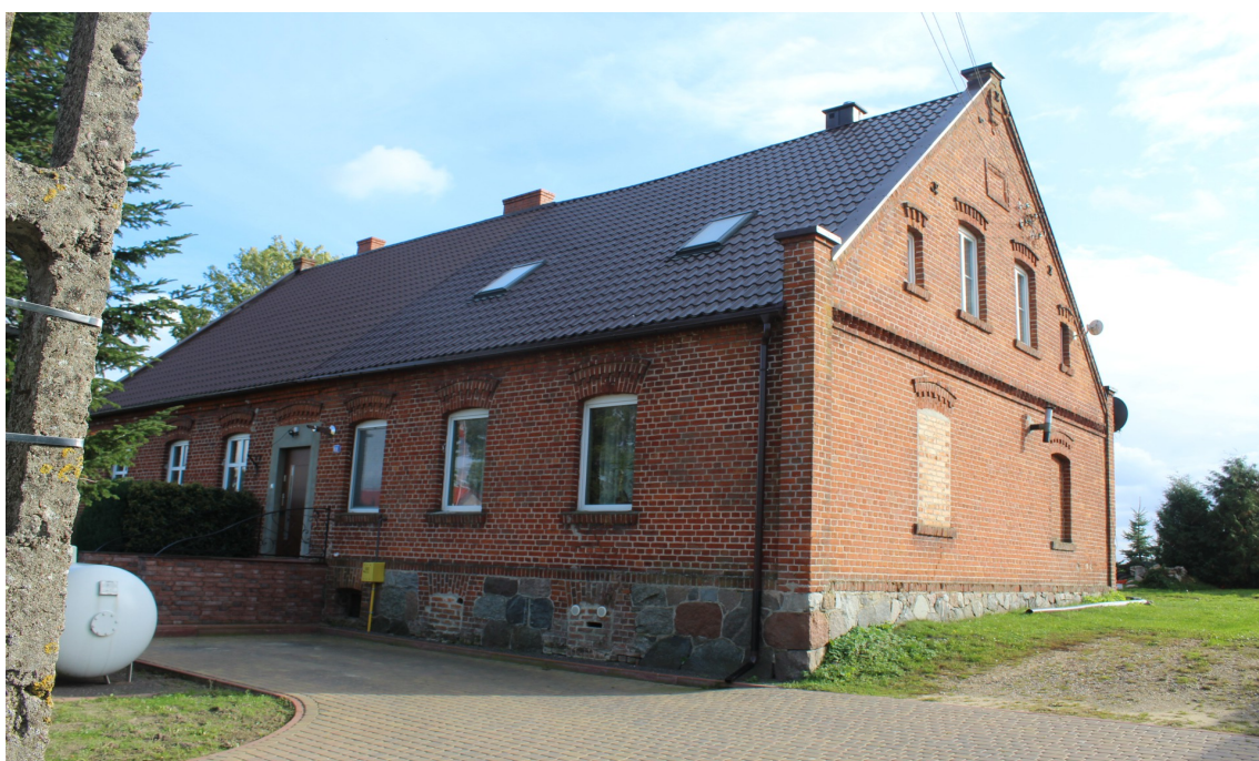
Ilustracja 63. Sławęcin 1 - budynek mieszkalny