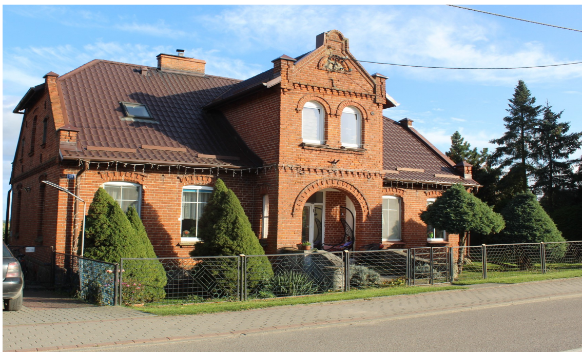
Ilustracja 67. Ostrowite ul. Główna 29 – budynek mieszkalny - charakterystyczny element – ryzalitowo wysunięta facjata z podcieniem wejściowym.