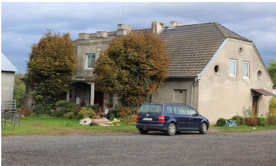
Ilustracja 93. Gockowice 24. Dworek w charakterze wiejskim.