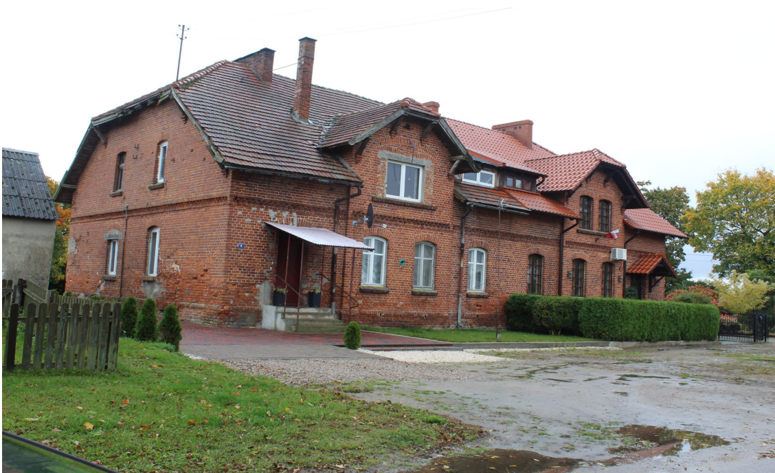
Ilustracja 69. Krojanty ul. Lipowa 6 – budynek mieszkalny bliźniaczy – budynek mieszkalny z półpiętrzem w poddaszu - charakterystyczny element – ryzalitowo wysunięta facjata.