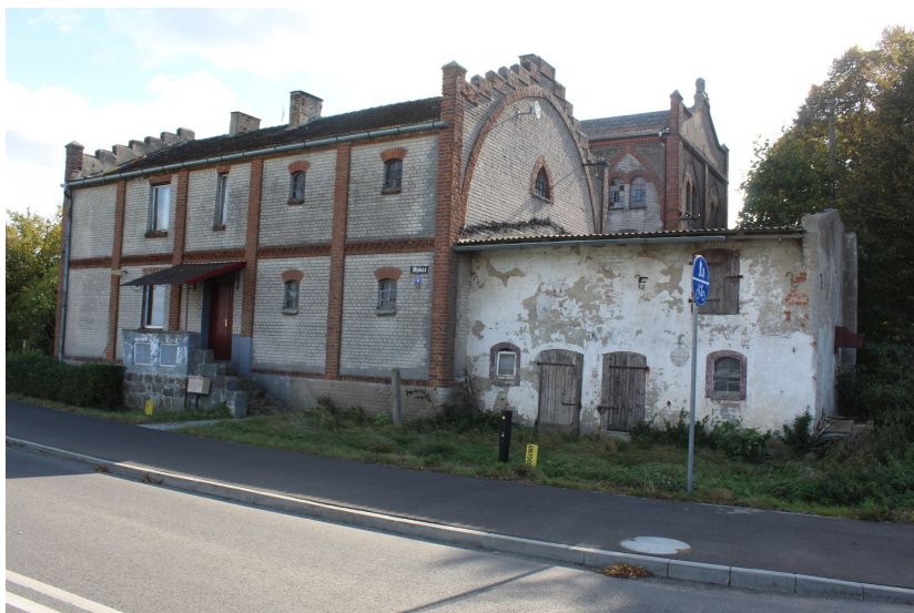
Ilustracja 74. Ogorzeliny ul. Młyńska 9 – zabudowa mieszkaniowa i gospodarcza.

Zabudowa gospodarcza na terenie gminy występuje zarówno przy obiektach wiejskich, jak i rezydencjonalnych. Zabudowa gospodarcza przy obiektach wiejskich to głównie zabudowa drewniana lub drewniano - murowana. Obiekty drewniane szalowane są deskami, często deskami luźnociosanymi, bez podmurówki. Obiekty murowane początkowo o uproszczonych formach, z czasem również zostały wzbogacone o elementy neostylowe – najczęściej w detalu ceglany. W konstrukcji obiektów gospodarczych murowanych częściej pojawia się w wątku lokalny kamień granitowy.