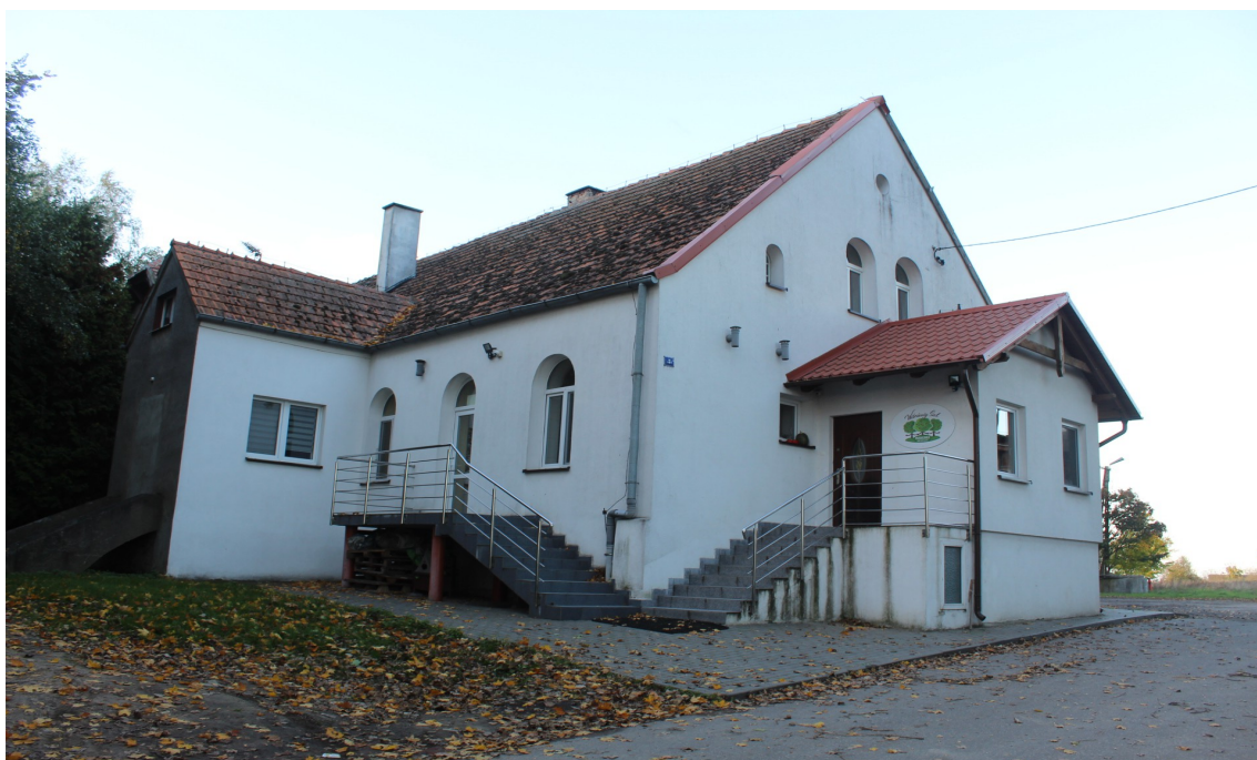
Ilustracja 92. Lichnowy, ul. Parkowa 7. Budynek w zespole dworsko-parkowym. Dwór w charakterze wiejskim.