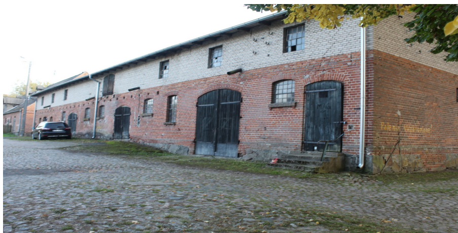
Ilustracja 100. Jarcewo, ul. Kasztanowa 2, budynek gospodarczy.

Budynek inwentarski, parterowy z niskim poddaszem, na planie wydłużonego prostokąta, posadowiony na niskim, ceglany cokole, opracowany w cegle, nakryty dachem dwuspadowym o lekkim nachyleniu połaci, kryty papą. Pierwotne rozmieszczenie otworów okiennych i drzwiowych. W elewacji wzdłużnej – południowej, 4 niewielkie otwory okienne kształtem zbliżone do kwadratu, zamknięte łukiem odcinkowym opracowanym w cegle, wsparte na ceglanych odcinkowych gzymsach podokiennych. W elewacji szczytowej – wschodniej wtórne drzwi bramne dwuskrzydłowe zwieńczone łukiem pełnym oraz drzwi jednoskrzydłowe zwieńczone łukiem odcinkowym, artykułowane ozdobnym fryzem ząbkowym opracowanym w cegle. W szczycie elewacji pierwotne drewniane drzwi w partii poddasza. Detal w formie gzymsu podokapowego flankowanego fryzem kostkowym, lizeny w układzie rytmicznym.