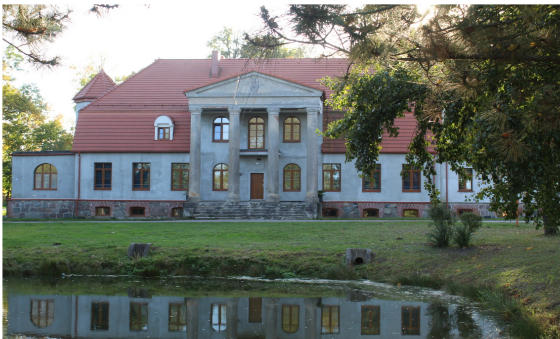
Ilustracja 91. Zbeniny 10. Budynek w zespole dworsko-parkowym. Obiekt odtworzony z zachowaną kolumnadą. Dwór z elementami architektury pałacowej. Wpisany do rejestru zabytków pod numerem 1606.