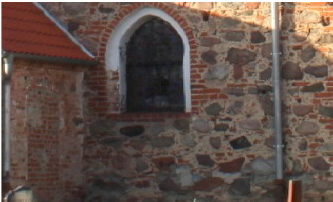
Ilustracja 47. Ostrowite – fragment elewacji kościoła - naturalna forma kamienia wpleciona w wążek ceglany.

Ostatnie zlodowacenie przyniosło na te tereny duże ilości ilów, glin, żwirów oraz głazów narzutowych. Lodowiec przyniósł materiał skalny z terenów Skandynawii, w tym charakterystyczne dla Szwecji granity w odcieniach czerwieni. Duże ilości trwałego materiału budowlanego, jakim był granit (którego nie trzeba było wydobywać z kamieniołomów) skutkowało wykorzystaniem tego budulca na masową skalę. Głazy oraz duże kamienie w formie otoczków wymagały przelupania dla uzyskania płaszczyzny. Często nie wymagały obróbki i w takiej formie były wykorzystywane na budowach. Granit jako materiał nienasiąkliwy służył do budowy najtrwalszych budowli, fundamentów, murów obronnych czy obróbek portali, okien i detali architektonicznych. Dostępność gliny i nowe techniki budowlane sprzyjały rozwojowi cegielni i ceglanego budownictwa. Dostępność żwiru sprzyjała budowie traktów oraz nawierzchni brukowanych w formie „kocich łbów”, również charakterystycznych dla tych ziem.