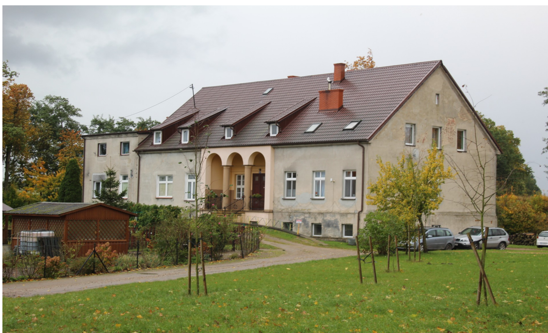
Ilustracja 94. Kruszka 16. Obiekt w zespole dworsko – folwarczno – parkowym. Dwór w charakterze wiejskim.