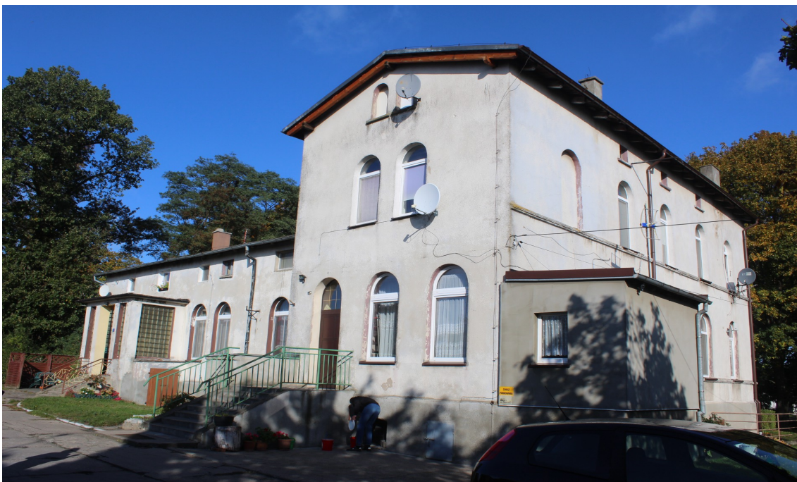
Ilustracja 90. Topole 1. Obiekt w zespole dworsko-parkowym. Dwór w charakterze budynku rezydencjonalnego. Budynek znacznie zaniedbany, bez zachowanego detalu architektonicznego.