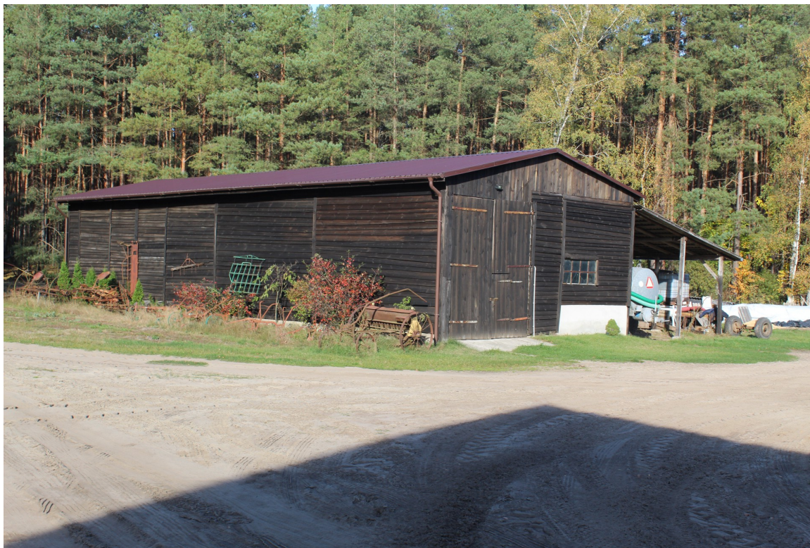
Ilustracja 76. Płesno 1a – stodoła