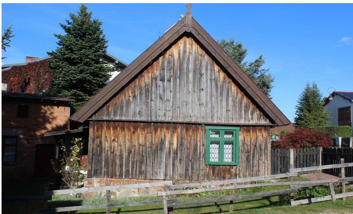
Ilustracja 52. Swornegacie ul. Mestwina 5 – charakterystyczne elementy – okna w oprawie snycerskiej, ceglany cokoł.