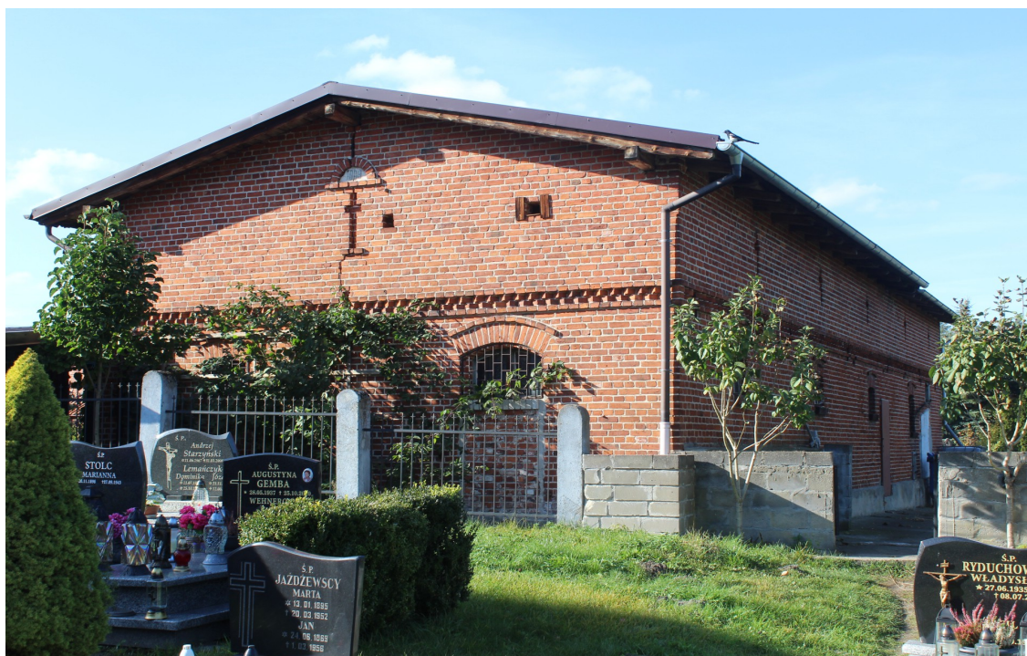
Ilustracja 77. Swornegacie ul. Mestwina 18 - budynek gospodarczy murowany z półpięciem w poddaszu.