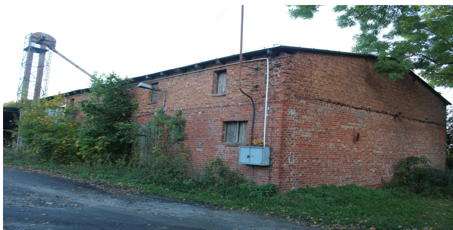
Ilustracja 107. Lichnowy ul. Parkowa 7, owczarnia.

Budynek stajni z oborą. Obiekt w konstrukcji murowanej. Okazała, zwarta, wydłużona bryła 2 – kondygnacyjna, dach dwuspadowy kryty eternitem. Elewacje kształtowane w cegle. Otwory okienne w formie zbliżone do kwadratu, zwieńczone łukiem odcinkowym, stolarka współczesna. W poddaszu niewielkie wrota, nad nimi okulus. W szczycie oryginalne zwieńczone łukiem odcinkowym wrota szalowane pionowo deskami. Budynek na kamiennym cokole z kamienia granitowego. Stolarka drzwiowa szalowana pionowo deskami. Od tyłu oryginalna przybudówka z wypłaszczonym jednospadowym dachem, krytym papą.