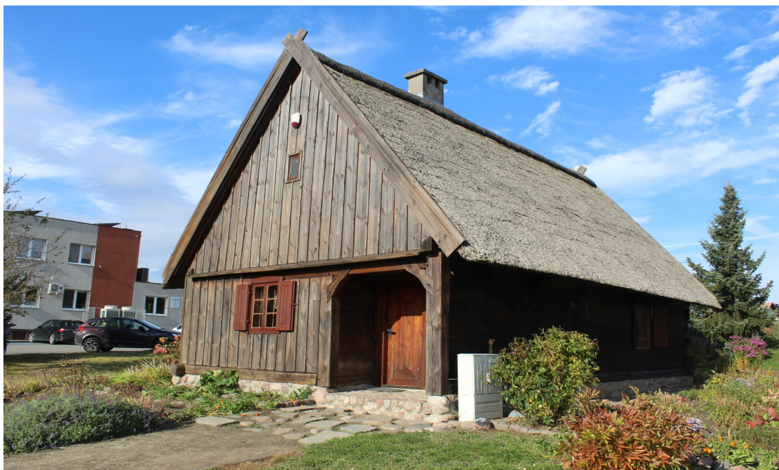
Ilustracja 48. Silno 49 – Chata kosznajderska.

Najczęściej występującymi mieszkalnymi budynkami drewnianymi są chaty szerokofrontowe. Budynki w konstrukcji zrębowej. Najczęściej pionowo szalowane