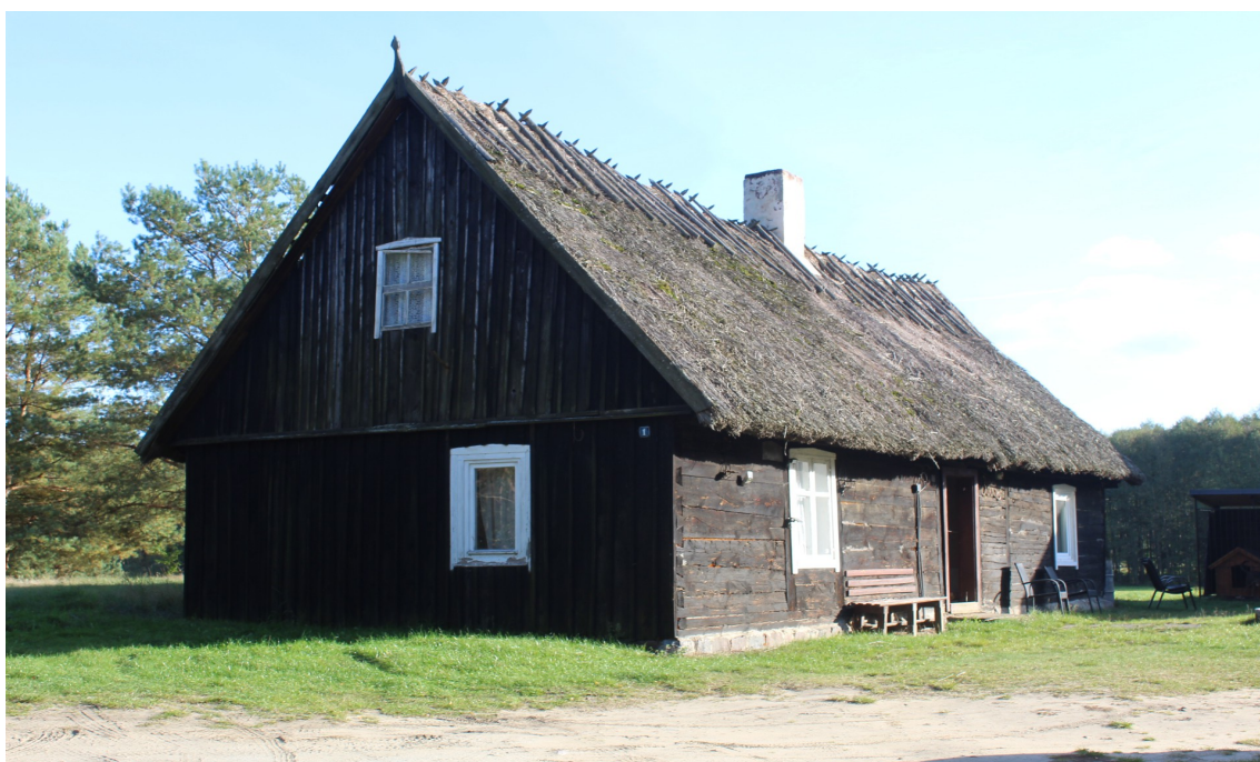
Ilustracja 50. Kamionka 1 – charakterystyczne elementy – okna w oprawie snycerskiej.