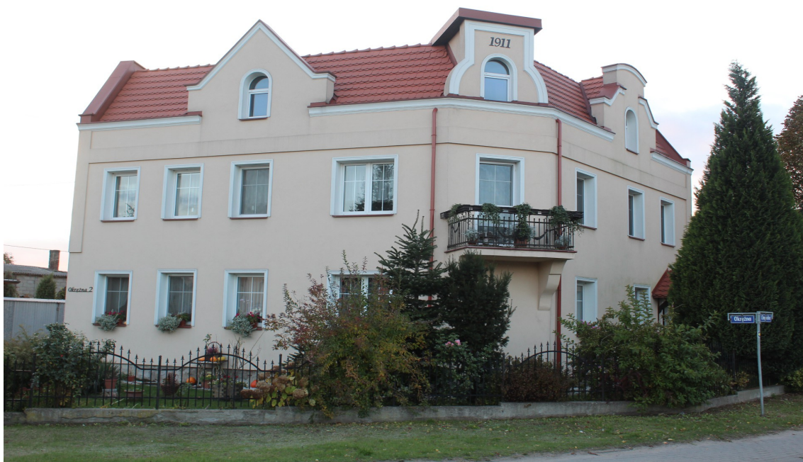
Ilustracja 72. Lichnowy ul. Okrężna 2 – zabudowa wiejska w typie kamienicy.