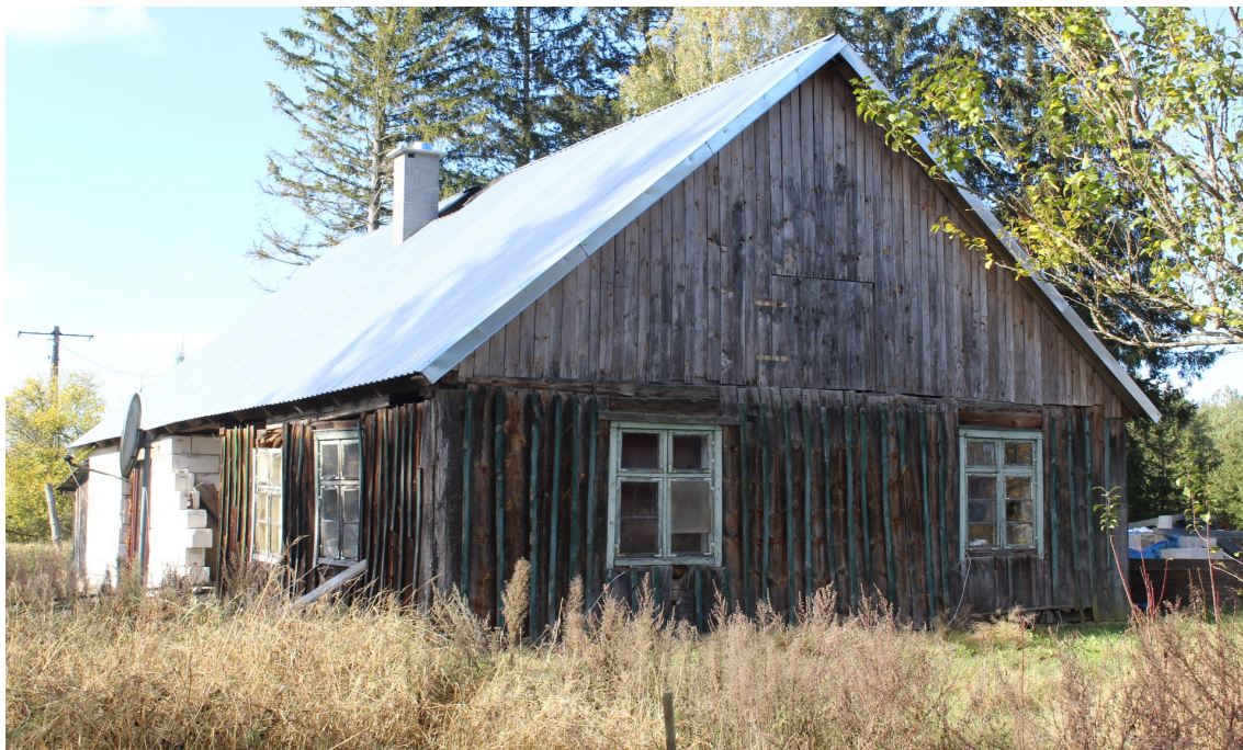
Ilustracja 53. Sepiot 2 - charakterystyczne elementy – okna w oprawie snycerskiej, malowane listwy lizenowe.