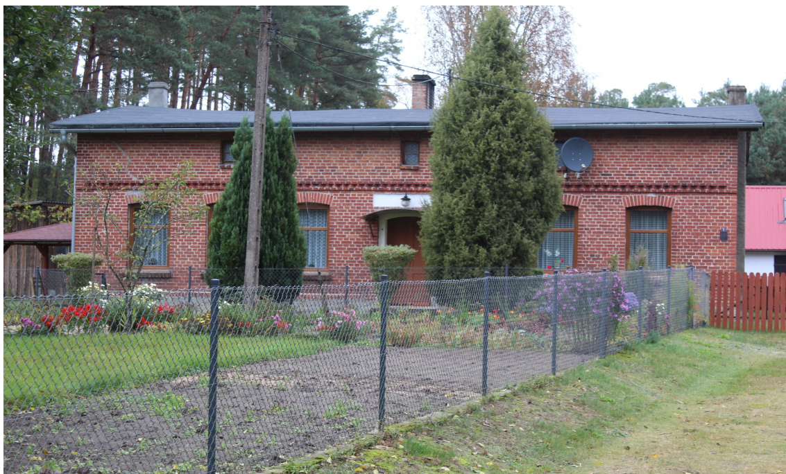
Ilustracja 62. Kopernica 3 – budynek mieszkalny z użytkowym półpiętrzem.

Ceglana architektura domów wiejskich naśladowała formy obecne w architekturze drewnianej, stąd pojawiły się domy z użytkowym poddaszem w formie półpiętra, z wypłaszczonym dachem i gzymsem, odcinającym parter od piętra (w budynku drewnianym była to deska okapowa).