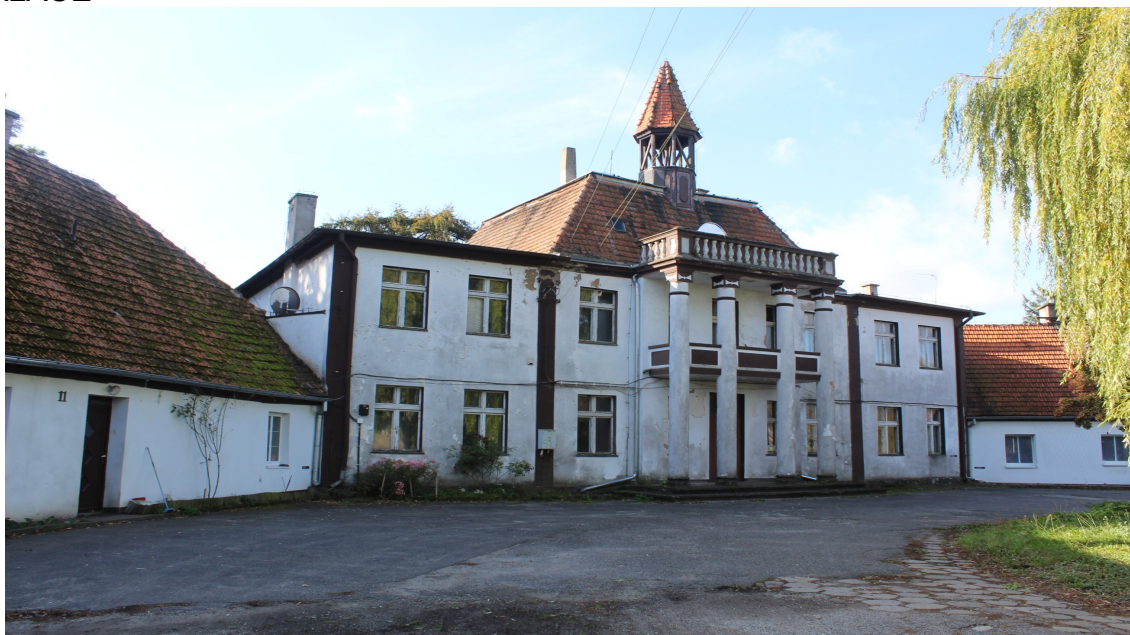
Ilustracja 79. Niezychowice nr 10. Pałac w zespole pałacowo – folwarczno -parkowym.