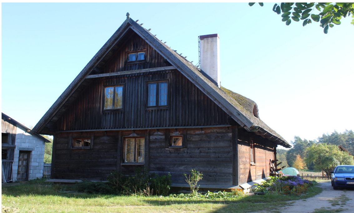
Ilustracja 49. Chociński Młyn 8 – charakterystyczne elementy – dwudzielny szczyt i okna w oprawie snycerskiej.

deskami, z poddaszem w dwuspadowym dachu, na kamiennej podmurówce. Obiekty te różnią się detalem i pokryciem dachu.