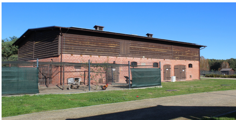
Ilustracja 96. Chociński Młyn 5, budynek gospodarczy w zespole dawnego dworu.

Budynek gospodarczy w zespole dawnego dworu, oddalony od dworu na pd.-zach. Budynek dwukondygnacyjny, opracowany w cegle z drewnianym użytkowym poddaszem, na rzucie wydłużonego prostokąta. Poddasze odeskowane w układzie poziomym. Nakryty dachem dwuspadowym o lekkim nachyleniu, kryty papą. Wtórne drzwi (odeskowane w układzie pionowym) nawiązujące rozmieszczeniem i wyglądem do historycznych. Otwory okienne i drzwiowe (w elewacji murowanej) zamknięte łukiem odcinkowym, opracowanym w cegle. Gzymsy podokienne z profilowanej cegły. W partii poddasza drzwi drewniane (odeskowane w układzie pionowym) - w części frontowej. Małe prostokątne okna w elewacjach szczytowych.