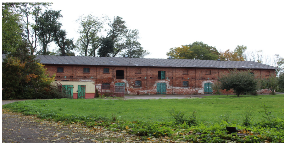
Ilustracja 105. Krojanty, ul. 18 Pułku Piechoty Ułanów Pomorskich 5, obora.

Budynek 2 – kondygnacyjny, na planie wydłużonego prostokąta, opracowany w cegle, posadowiony na niskim, kamiennym cokole. Nakryty dachem dwuspadowym o lekkim nachyleniu połaci, kryty eternitem. Zachodnia elewacja przylega prostopadle do budynku gorzelnii. Częściowo zachowane otwory drzwiowe. W elewacji południowej – wzdłużnej, w jej części zachodniej, schody do budynku; drzwi drewniane oraz pierwotne dwie bramy drewniane szalowane pionowo; otwory drzwiowe zwieńczone łukiem odcinkowym opracowanym w cegle. Liczne ślady zamurowań otworów okiennych i drzwiowych, zarówno na poziomie parteru jak i w partii drugiej kondygnacji, w niej liczne otwory wentylacyjne w formie krzyża. Zachowane opracowane w cegle łuki odcinkowe zamurowanych otworów okiennych i drzwiowych.