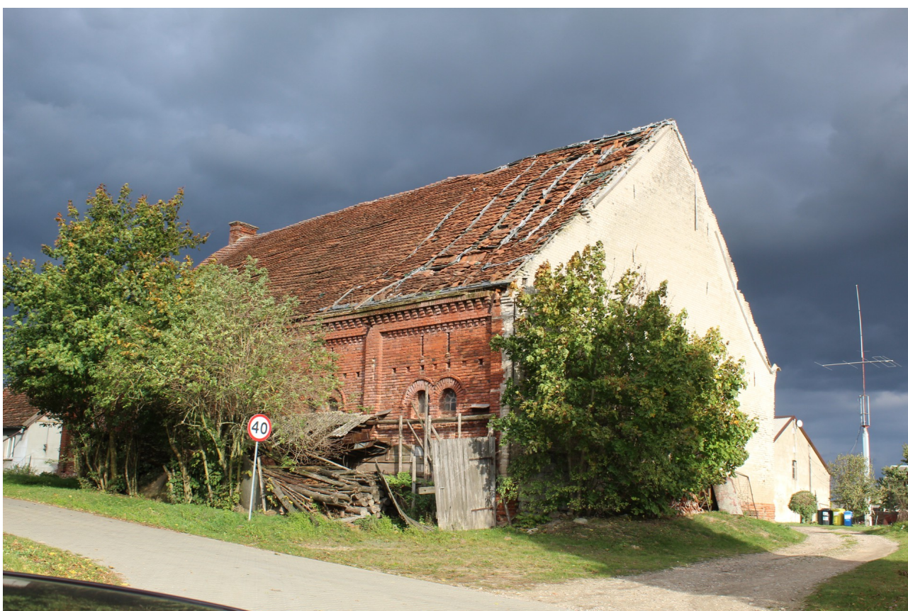
Ilustracja 78. Sternowo 17 – okazały budynek gospodarczy z bogatym detalem neostylowym.