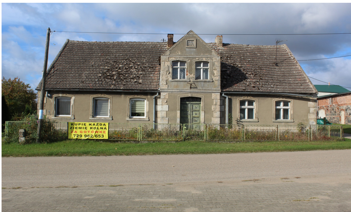
Ilustracja 71. Moszczenica 39-39A – budynek mieszkalny – charakterystyczny element – ryzalitowo wysunięta facjata na osi oraz tynkowana elewacja z detalem architektonicznym.

W największych wsiach zaczyna pojawiać się zabudowa w formie niewielkiej miejskiej kamienicy, najczęściej z użytkowym parterem. Budynek te przypominają formy miejskiej architektury, mają skromniejszy detal. W zespołach przemysłowych budynki mieszkalne nawiązują do obiektów techniki.