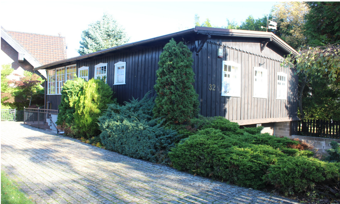
Ilustracja 56. Charzykowy ul. Turystyczna 32 – budynek letniskowy.

Na terenie gminy znajdują się również zabytkowe budynki drewniane o charakterze letniskowym – parterowe, ze stolarką z okiennicami.