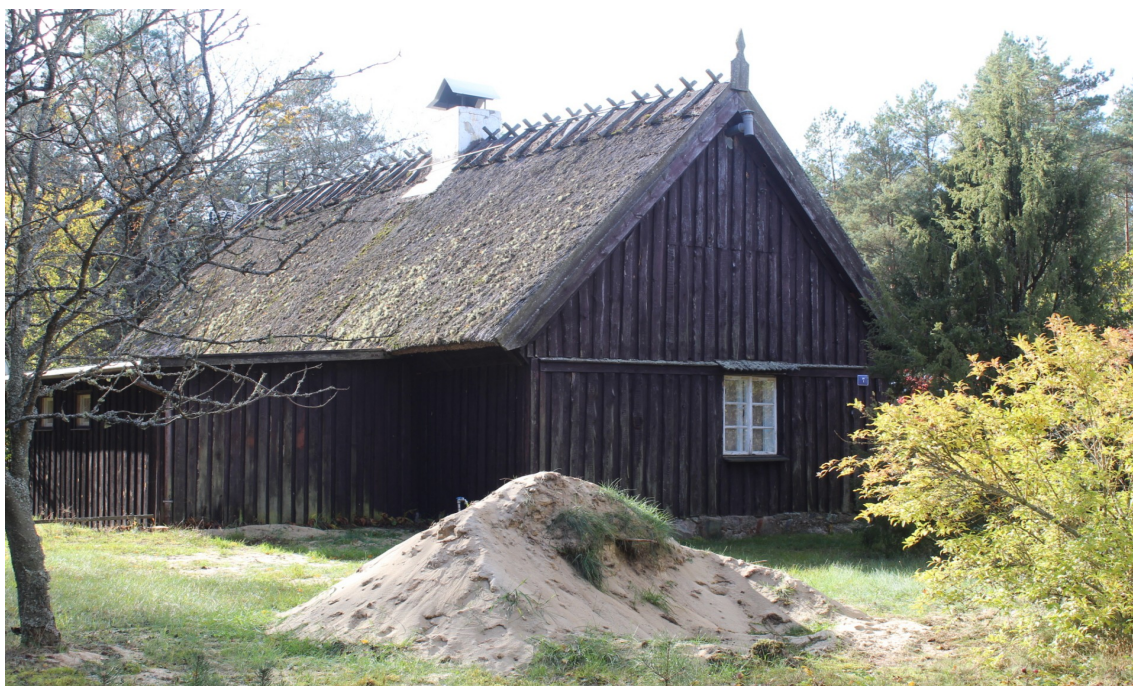
Ilustracja 54. Sepiot 7 - charakterystyczne elementy – zachowana stolarka okienna .

Kolejnym typem mieszkalnej zabudowy drewnianej są domy z użytkowym poddaszem w formie półpiętra – wysokiej ściany kolanowej z wypłaszczonego dwuspadowym dachem. Elewacje dzielone są na dwie części deską okapową. Znaczna część domów posiada okiennice.