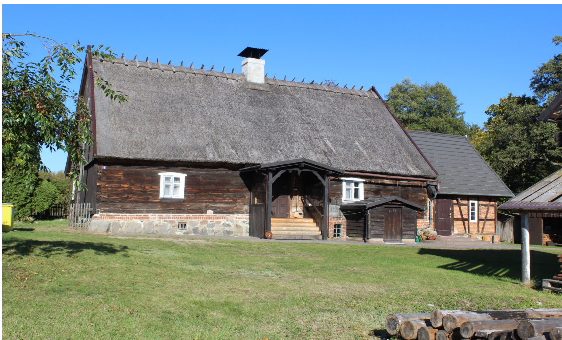
Ilustracja 46. Chociński Młyn – budynek w zespole młyna – przykład architektury drewnianej z przełomu XIX i XX wieku. W budynku widoczne inne dostępne lokalne materiały budowlane.

Krajobraz naturalny i antropogeniczny na terenie dzisiejszej gminy Chojnice wzajemnie się uzupełniają. Niewątpliwie krajobraz naturalny wciąż dominuje, będąc głównym bogactwem gminy. Struktura osiedleńcza kształtująca się na tym terenie od ponad 1000 lat, krystalizować zaczęła się około 700 lat temu, wraz z przybyciem nowych osadników zakonu krzyżackiego, którzy wnieśli na te tereny nową mentalność i nowatorskie technologie. Szybko rozwijające się społeczeństwo w nowych warunkach politycznych zaczęło wznosić budynki z materiałów trwałych – które zmieniały w znaczący sposób krajobraz. Dzięki bogatej historii i przeobrażeniom (m.in. kolejne zlodowacenia), lokalna społeczność miała do dyspozycji na tych terenach ogromny wachlarz łatwo dostępnych materiałów budowlanych. Wpłynęły one na charakter i jakość architektury oraz kształtowały ją aż do lat 30. XX wieku, kiedy to na tych terenach pojawiły się nowe technologie budowlane. Do przełomu XIII i XIV wieku dominowała w przedmiotowym obszarze architektura drewniana. Związane było to głównie z dostępnością surowca budowlanego, jakim było drewno. Licznie występowały na tych terenach buki, dęby oraz sosny. Każde z tych gatunków charakteryzowało się innymi właściwościami budowlanymi, które umożliwiały wznoszenie różnego rodzaju trwałych obiektów drewnianych.