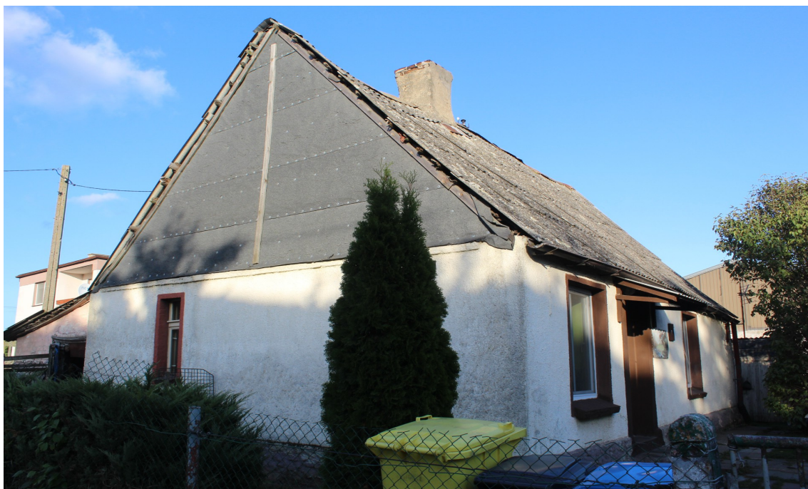
Ilustracja 58. Ostrowite, ul. Główna 7 – chałupa z drewnianym szczytem.

W ostatniej ćwierci XIX wieku, obok budynków drewnianych powstają obiekty murowane – z cegły, nietynkowane, na kamiennym cokole – z lokalnego kamienia granitowego. Budynki nawiązują formą i gabarytem do obiektów drewnianych. Są to budynki murowane w typie chałupy.