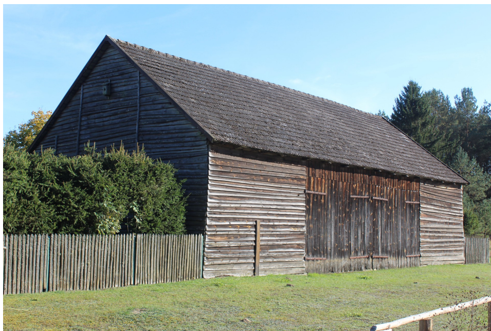
Ilustracja 75. Zbrzyca 45 – stodoła.

Zabudowa gospodarcza na terenie gminy występuje zarówno przy obiektach wiejskich, jak i rezydencjonalnych. Zabudowa gospodarcza przy obiektach wiejskich to głównie zabudowa drewniana lub drewniano - murowana. Obiekty drewniane szalowane są deskami, często deskami luźnociosanymi, bez podmurówki. Obiekty murowane początkowo o uproszczonych formach, z czasem również zostały wzbogacone o elementy neostylowe – najczęściej w detalu ceglany. W konstrukcji obiektów gospodarczych murowanych częściej pojawia się w wątku lokalny kamień granitowy.