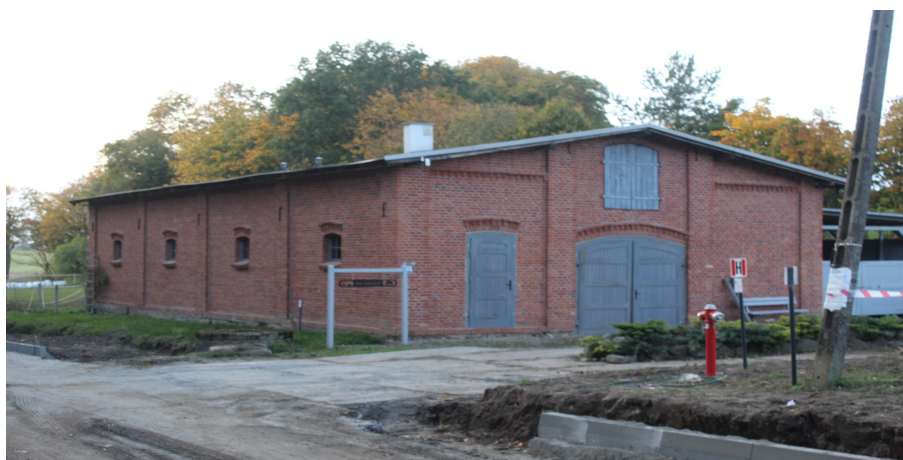
Ilustracja 99. Jarcewo, ul. Kasztanowa 5, obora.

Budynek inwentarski, spichlerz w zespole folwarcznym, parterowy z wysokim dwukondygnacyjnym użytkowym poddaszem, na rzucie wydłużonego prostokąta o konstrukcji – ceglano szkieletowej. Budynek posadowiony na kamiennym cokole na ceglanej podmurówce. Elewacje szczytowe i elewacja północna opracowane w cegle. Elewacja frontowa (południowa) o konstrukcji ryglowej wypełnionej cegłą. Budynek nakryty dachem dwuspadowym, o znacznym kącie nachylenia połaci, kryty blachodachówką w kolorze ceglanym. W połaci południowej dachu okna połaciowe i kolektory słoneczne. Zachowana pierwotna bryła i układ otworów okiennych i drzwiowych. Otwory okienne w elewacjach szczytowych oraz dwa otwory okienne w elewacji frontowej. Wtórna przybudówka w elewacji szczytowej zachodniej.