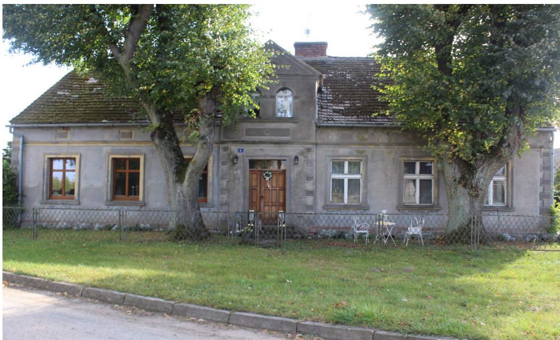
Ilustracja 70. Moszczenica 5 – budynek mieszkalny – charakterystyczny element – na osi oraz tynkowana elewacja z detalem architektonicznym.