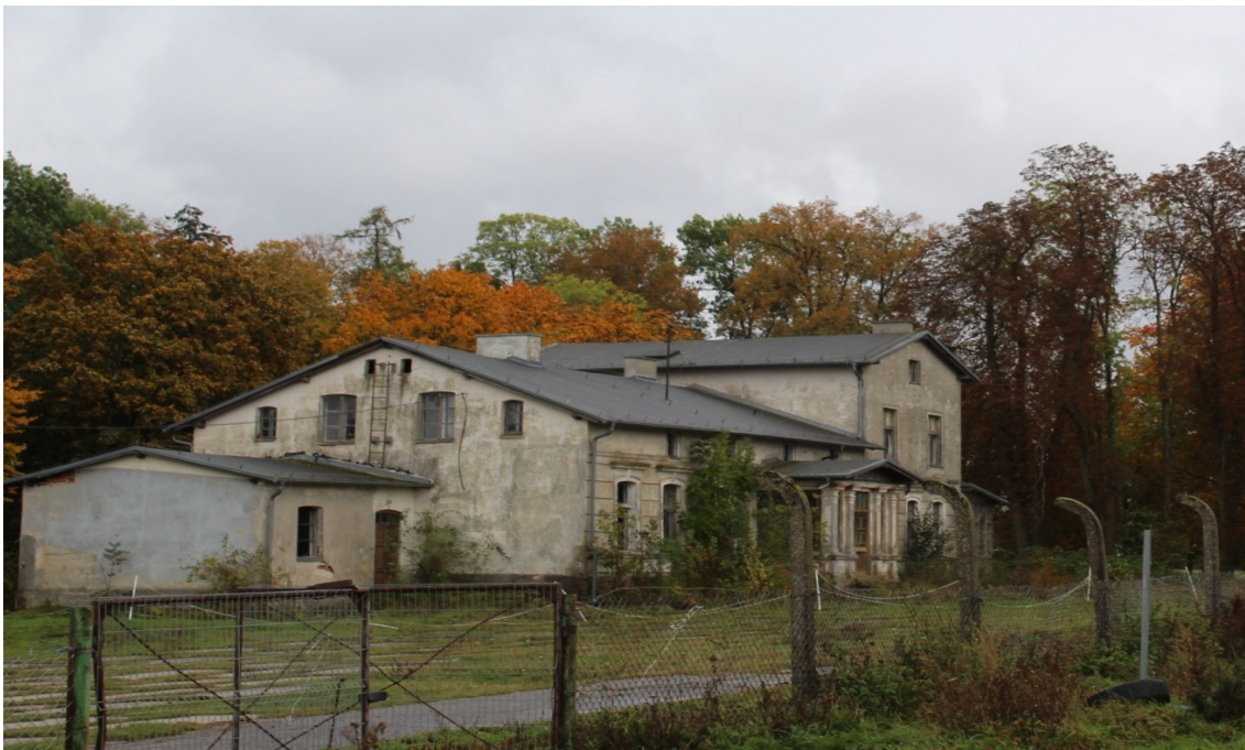
Ilustracja 89. Szlachetna Nowa Cerkiew 20. Obiekt w zespole dworsko-parkowym. Dwór w charakterze budynku rezydencjonalnego.