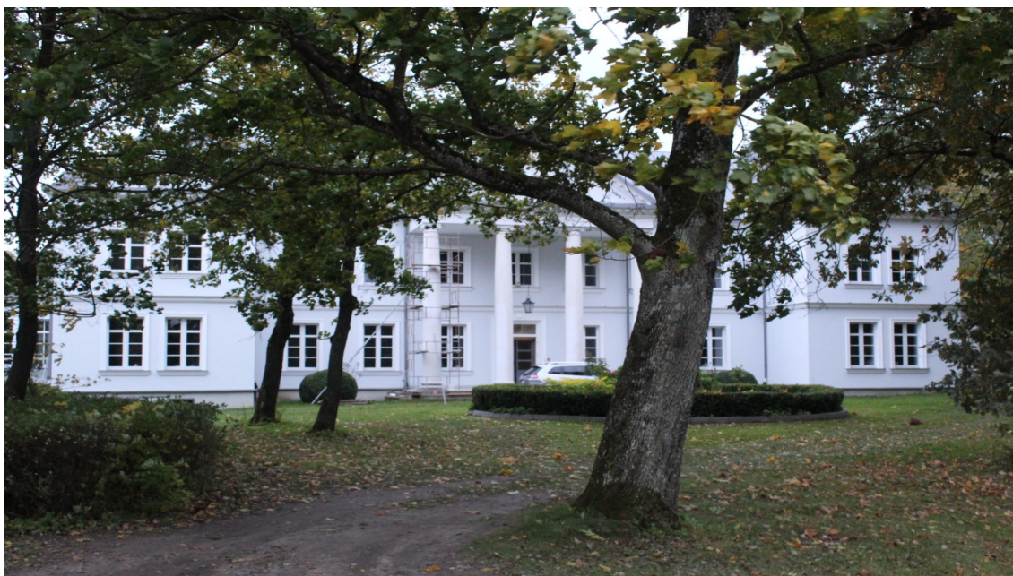
Ilustracja 80. Pawłowo ul. Tucholska nr 15. Budynek w zespole pałacowo-parkowym.