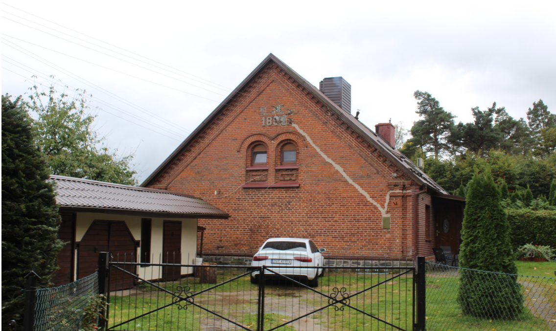
Ilustracja 59. Kłodawa 2 – budynek mieszkalny – charakterystyczny element biforium w szczycie.