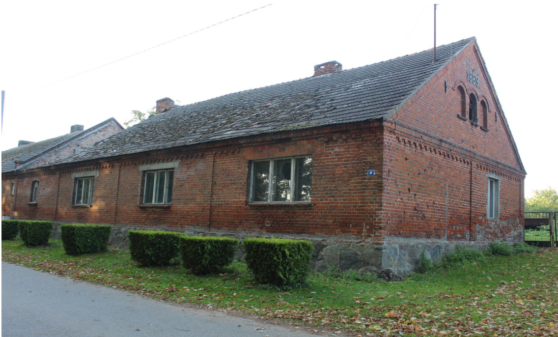
Ilustracja 60. Powalki ul. Parkowa 6-8 – budynek mieszkalny – charakterystyczny element triforium z niszami w szczycie.