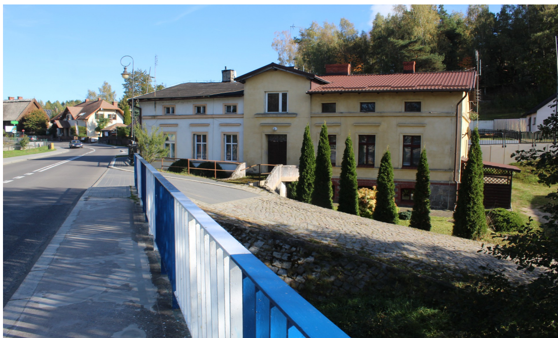
Ilustracja 73. Swornegacie ul. Podgórna 2 – zabudowa mieszkalna. Obiekt z zachowanym detalem architektonicznym.