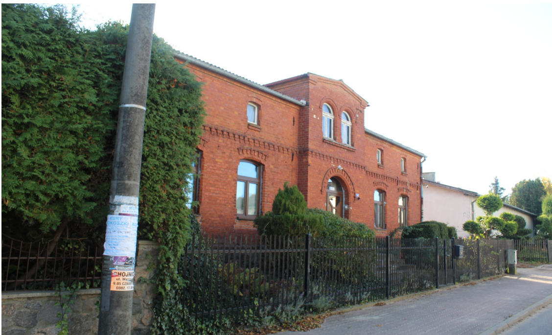
Ilustracja 68. Charzykowy ul. Długa 46 – budynek mieszkalny z półpiętrzem w poddaszu - charakterystyczny element – ryzalitowo wysunięta facjata z podcieniem wejściowym.