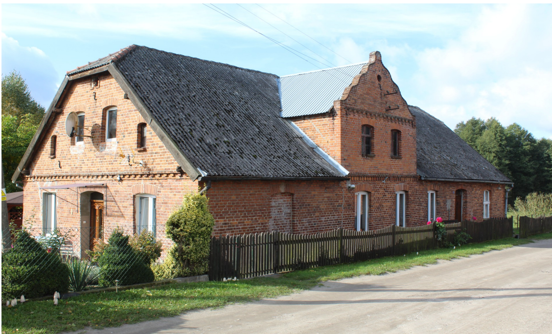
Ilustracja 64. Doręgowice 12 - budynek mieszkalny - charakterystyczny element facjaty z naczółkiem dekorowanym na obrysie w formie attyki.

Budynki rezydencjonalne najczęściej charakteryzowała rozbudowana, oryginalna, neostylowa bryła, o różnej formie. Element wspólny stanowiło podkreślenie wejścia głównego. Dominowało w architekturze wiejskiej bogatych rolników. W szczycie na osi elewacji frontowej pojawiała się okazała lukarna, stanowiąc tym samym poddasze bardziej użytkowym. Lukarna zaczęła przechodzić ryzalitowo w wysunięcie środkowej osi elewacji, w której znajdowały się drzwi. Często pojawiał się portal wgłębny lub podcień.