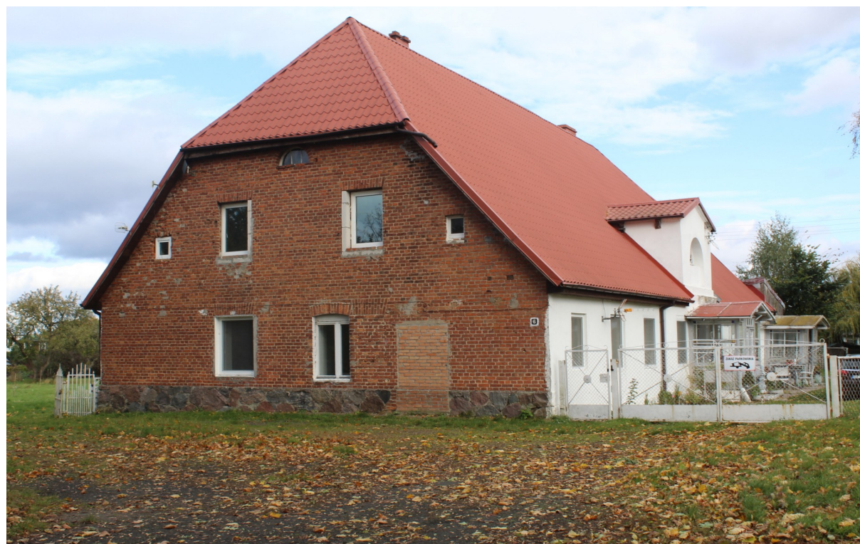
Ilustracja 95. Ogorzeliny, ul. Stary Dwór 6. Obiekt w zespole dworsko – folwarcznym. Dwór w charakterze wiejskim, częściowo przebudowany.